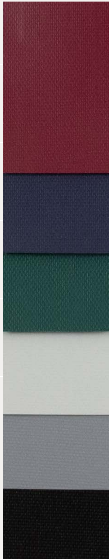
Bordeaux - ●