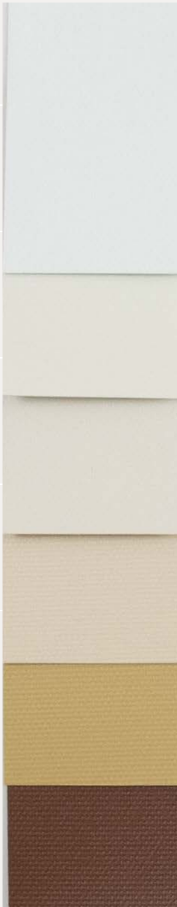
Bianco - ● ● ●